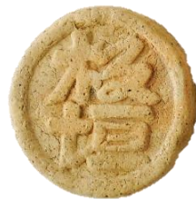
▲高知市内で発掘された泥めんこ（高知市蔵）